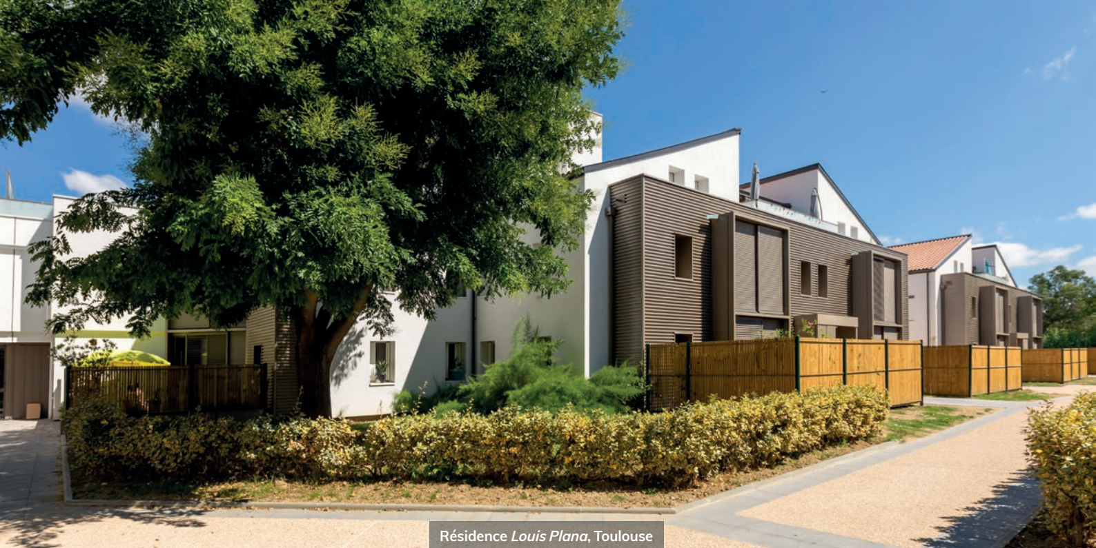
Résidence Louis Plana , Toulouse