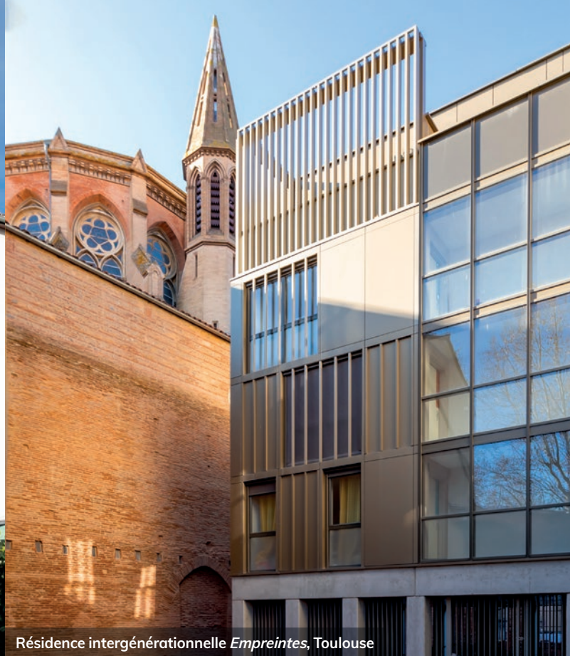
Résidence intergénérationnelle Empreintes , Toulouse