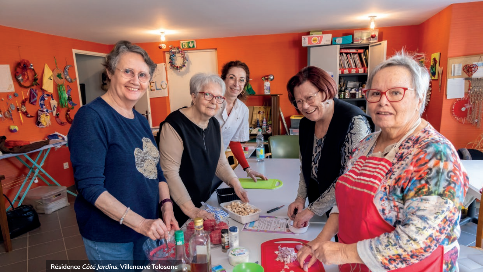
Résidence Côté Jardins , Villeneuve Tolosane