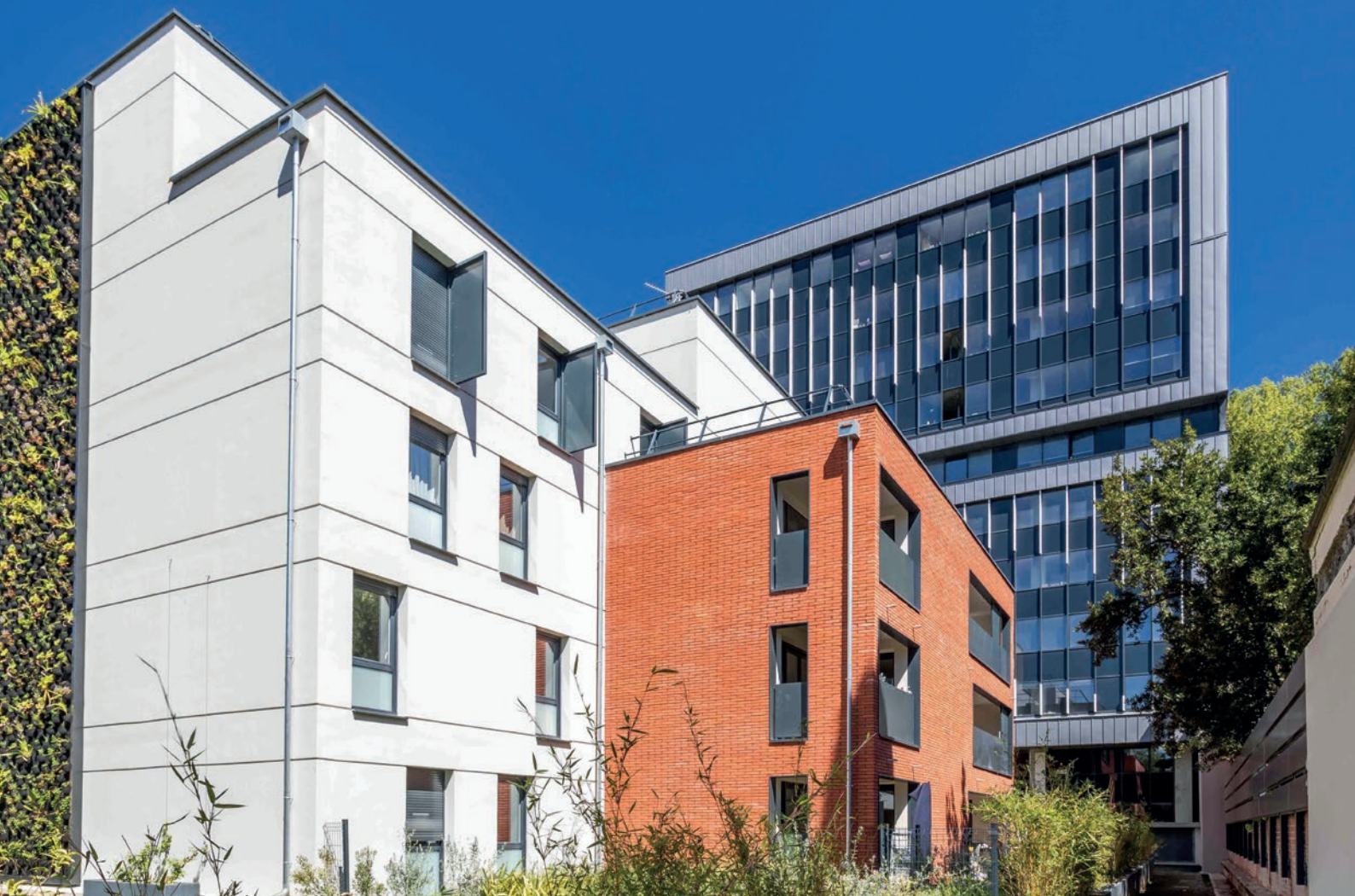
Résidence Les Reflets de Brienne et résidence étudiante L'annexe , Toulouse