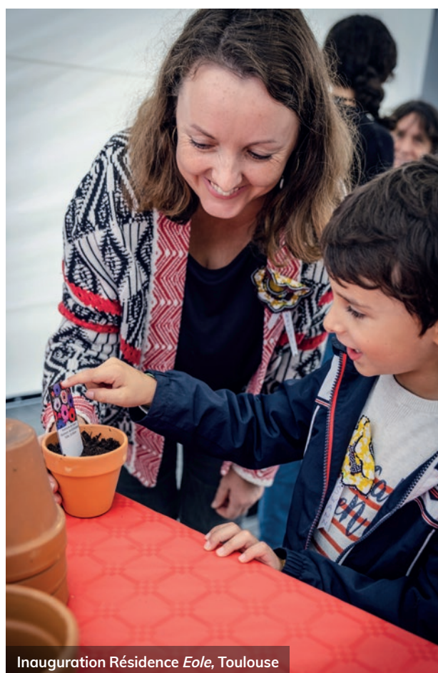
Inauguration Résidence Eole , Toulouse