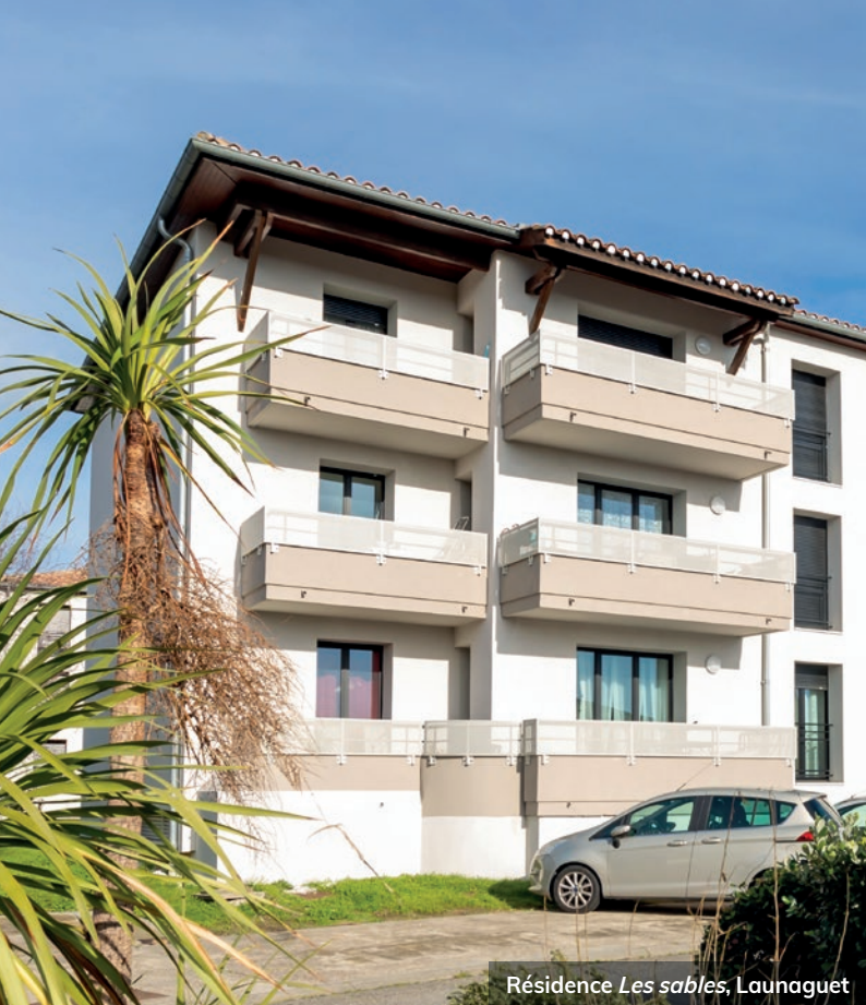
Résidence Les sables , Launaguet