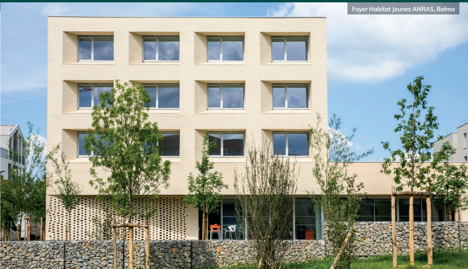
Foyer Habitat Jeunes ANRAS , Balma