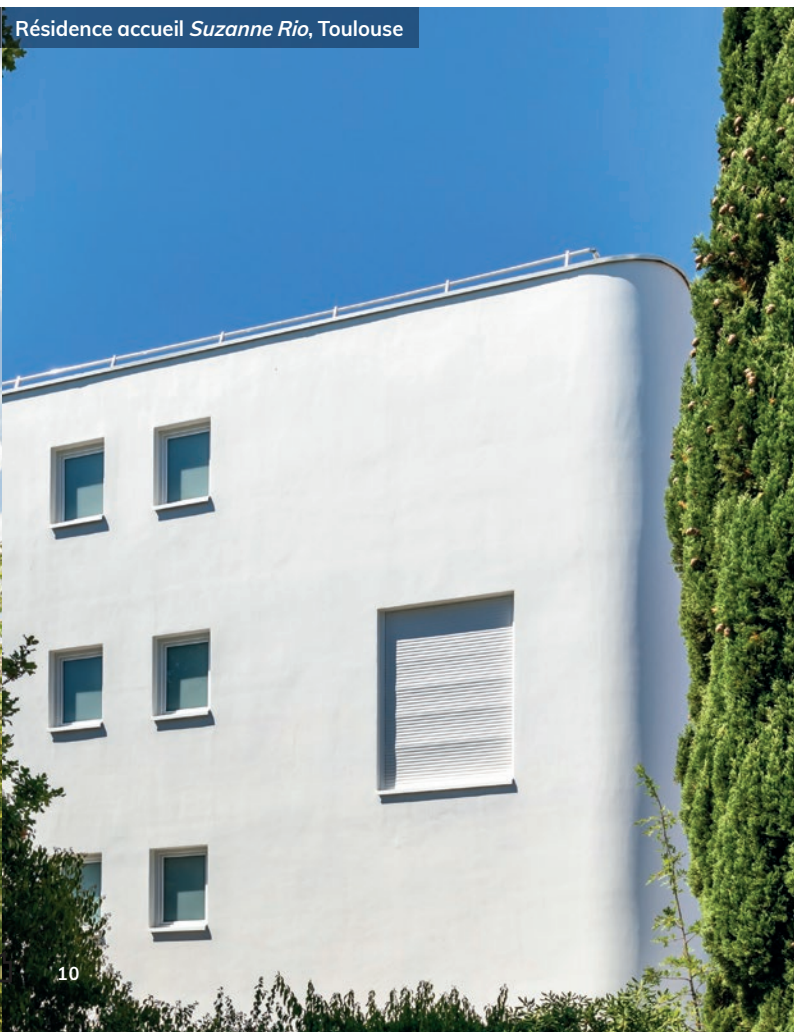
Résidence accueil Suzanne Rio , Toulouse