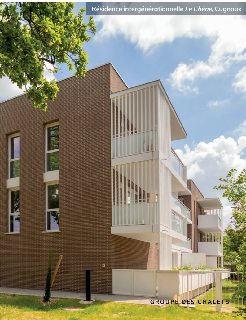
Résidence intergénérationnelle Le Chêne , Cugnaux