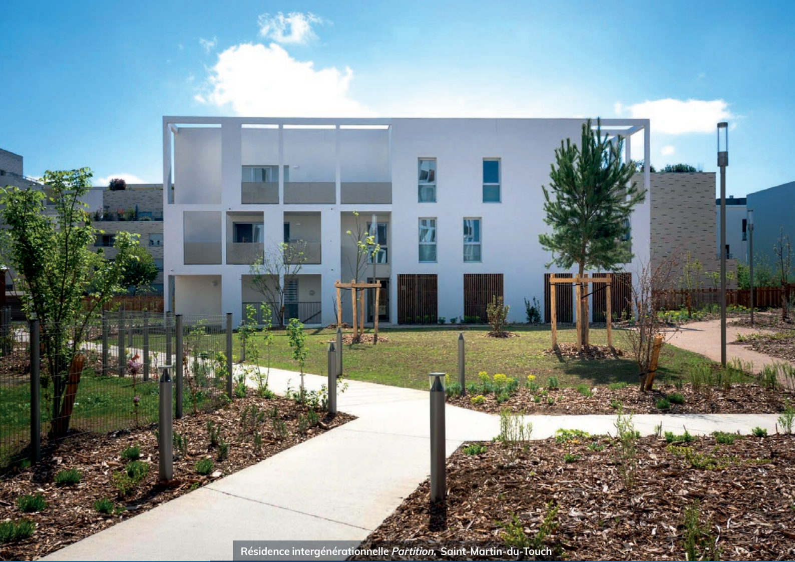
Résidence intergénérationnelle Partition , Saint-Martin-du-Touch