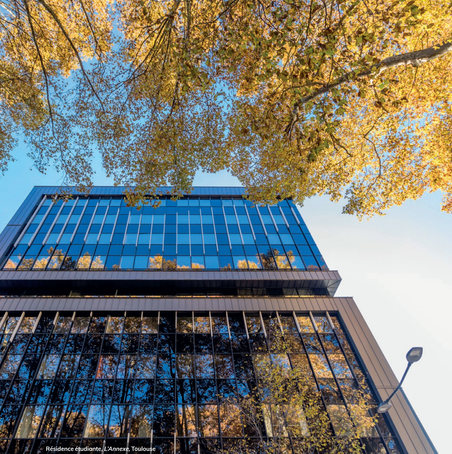
Résidence étudiante, L'Annexe , Toulouse