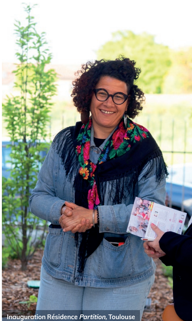
Inauguration Résidence Partition , Toulouse

Le Groupe des Chalets promeut une organisation de proximité pour favoriser le dialogue au plus près des habitants et des territoires. La gestion locative du Groupe des Chalets est organisée autour de 3 agences réparties sur le territoire de la métropole toulousaine.