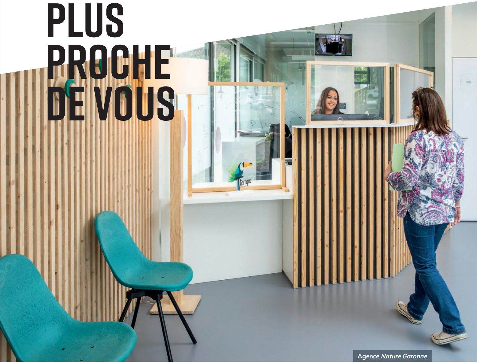
Agence Nature Garonne

Une implantation au plus près des territoires