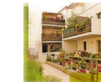
Rue des Cinq Clous / Toulouse